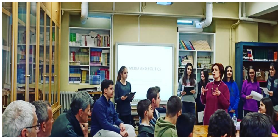
Exposé des élèves en anglais sur les médias et les politiques

Les professeurs ont un rôle de facilitateur, d'encadrant bienveillant qui permet aux élèves de développer leurs compétences.